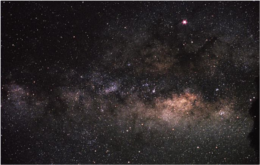
Imagen de los Cielos de La Palma tomada el 20 de Abril de 2007, la misma noche en que fue adoptada la Declaración.